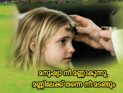
മനുഷ്യാ നി മണ്ണാകുന്നു, മണ്ണിലേക്ക് തന്നെ നി മടങ്ങും