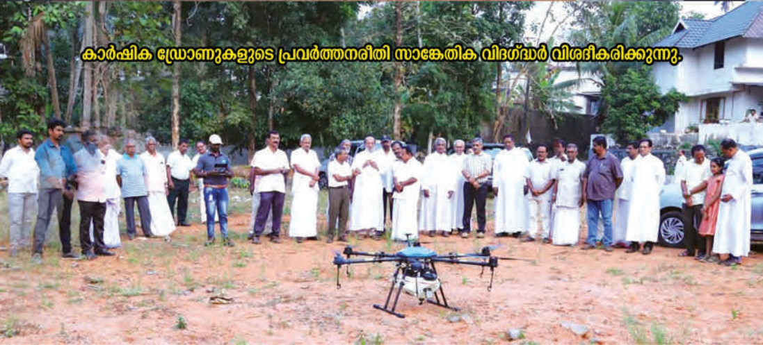
കാർഷിക ഡ്രോൺകളുടെ പ്രവർത്തനരീതി സാങ്കേതിക വിദഗ്ദ്ധർ വിശദീകരിക്കുന്നു.