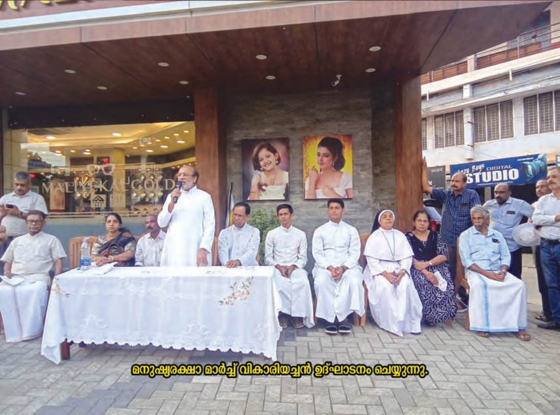
മനുഷ്യക്ഷാ മാർച്ച് വികാരിയച്ചൻ ഉദ്ഘാടനം ചെയ്യുന്നു.