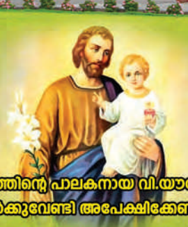
തിരുകുടുംബത്തിന്റെ പാലകനായ വി. യൗസേപ്പിതാവേ തങ്ങൾക്കുവേണ്ടി അപേക്ഷിക്കേണമെ.