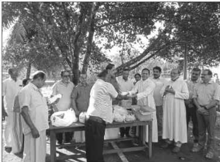
കോതമംഗലം സോഷ്യൽ സർവീസ് സൊസൈറ്റി നിർമ്മിക്കുന്ന ഭൂതപണങ്ങളുടെ വിപണനോദ്ദേശ്യം ഫയറാഫ്ക്ട് ഓ. ജോർജ് പൊട്ടയ്ക്കൽ നിർവഹിക്കുന്നു.