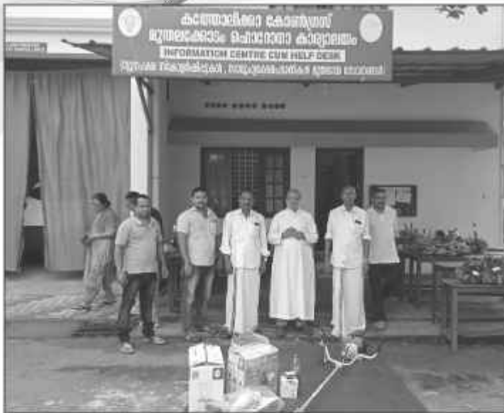
SMAM മൂന്നാം ഘട്ടത്തിൽ അനുവദിച്ച കാർഷിക യന്ത്രങ്ങൾ വികാരിയച്ചൻ ഗുണഭോക്താക്കൾക്ക് നൽകുന്നു.