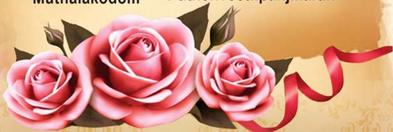
Litjy Rose Puthenveetilpanjikan